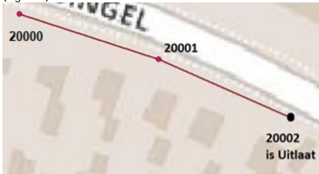
Figuur 2 Voorbeeldstelsel A

Om een voorbeeld van KNOOPPUNT.CSV en VERBINDING.CSV te geven wordt het onderstaande 'stelsel' gebruikt (Figuur 2).